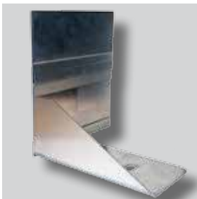
ND GARDLINER® StaalLight 210VH