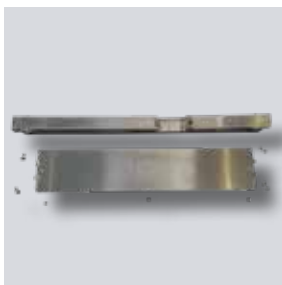
Grondplaat, verstelbare verhoger met profielhouder, bouten en moeren.

Het ND Solar Montagesysteem voor Groendaken wordt d.m.v. de ND Solar Ballastdrager op het drainagesysteem geballast en hoeft zo niet op de dakbedekking geplaatst te worden en de verstelbare verhoger hoeft hierdoor niet door het drainagesysteem heen te gaan. Dit betekent ook dat het montagesysteem eenvoudig kan worden gepositioneerd en aangepast aan de gewenste paneeloriëntatie en ondersteunt zo een zeer flexibele manier om zonnepanelen te installeren. Dit type installatie helpt ook om hydrostatische druk op het dakbedekkingssysteem te voorkomen. Doordat de verhoger verstelbaar is, kunnen afschot en oneffenheden gecompenseerd worden. De verhoger kan in stappen van 2 cm op 4 niveaus ingesteld worden.