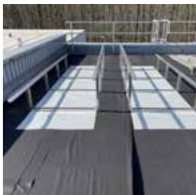
ND Solar Montagesysteem voor Groendaken

Modulair, geballast montagesysteem voor het plaatsen van losse zonnepanelen / rijen zonnepanelen op een groendak. Bij dit systeem wordt er voldoende afstand tussen de vegetatie en de zonnepanelen gehouden, zodat beiden optimaal functioneren. Het ND Solar Montagesysteem voor Groendaken bestaat uit een grondplaat, verstelbare verhoger met profielhouder, bouten en moeren. De verstelbare verhoger en profielhouder zijn reeds aan elkaar gemonteerd om een snelle installatie te bewerkstelligen.