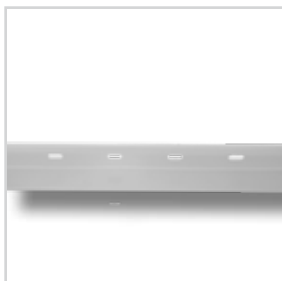
ND Erosionsschutzprofil (exklusiv ND Befestigungsclips)

Das ND Erosionsschutzprofil ist ein starres Profil aus Kunststoff mit einer Höhe von ca. 45 mm. In das Profil sind Langlöcher eingestanzt. Sie dienen der Befestigung des Profils mit dem ND Befestigungsclip am ND ESG-40/40 Erosionsschutzgitter zur Fixierung der ND SM-50 Substratmatte oder ND DGS-M Mineralsubstrat.