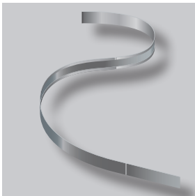
ND GARDLINER® StahlLight

GARDLINER® StahlLight ist ein aus verzinktem Stahlblech gefertigtes Randeinfassungssystem. Ein einzelnes StahlLight-Paket beinhaltet 20 lfm. Die Profile sind in den Höhen 110, 160 und 210 mm erhältlich und sie bilden eine dauerhafte Abgrenzung zwischen Bepflanzungen und wassergebundene Wege. Die 0,9 mm dicken Profile sind leicht zu biegen, wodurch gerade Linien und geschwungene Kurven einfach zu gestalten sind. Die Profile sind an der Ober- und Unterseite mit einem 3 mm breiten Falz versehen.