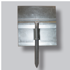
ND GARDLINER® StahlLight 210V