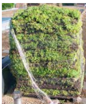
ND Vegetationsmatte - Sedum